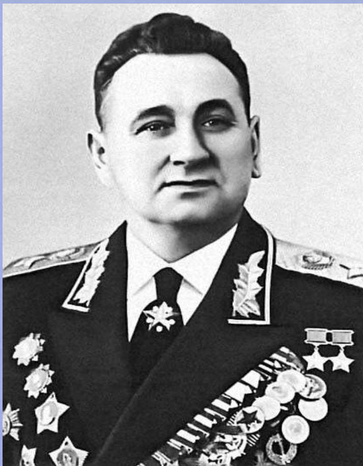
Гречко Андрей Антонович