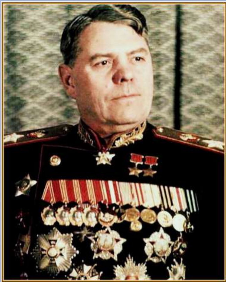
Александр Михайлович Василевский