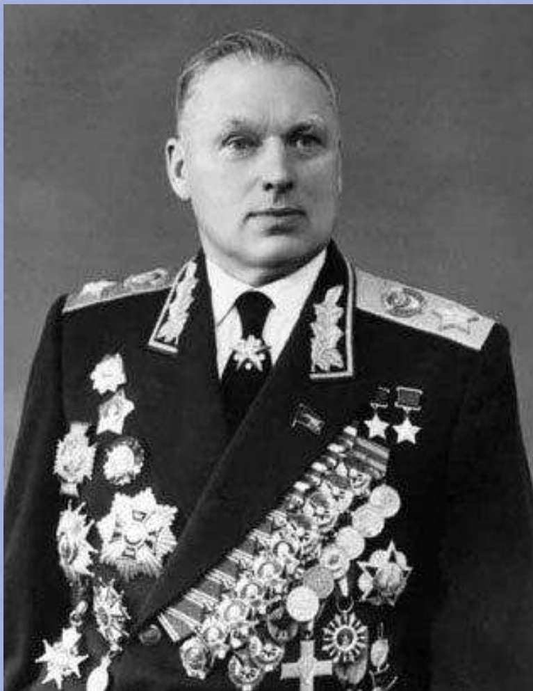
Константин Константинович Рокоссовский