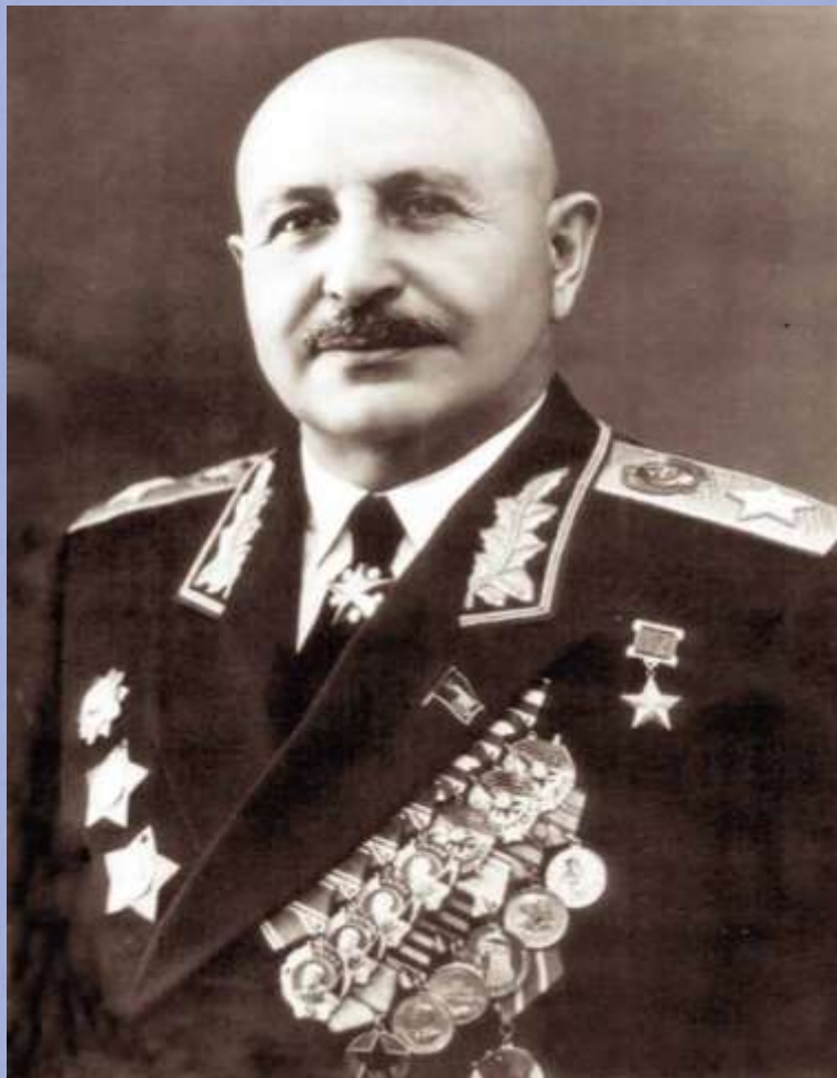
Иван Христофорович Баграмян