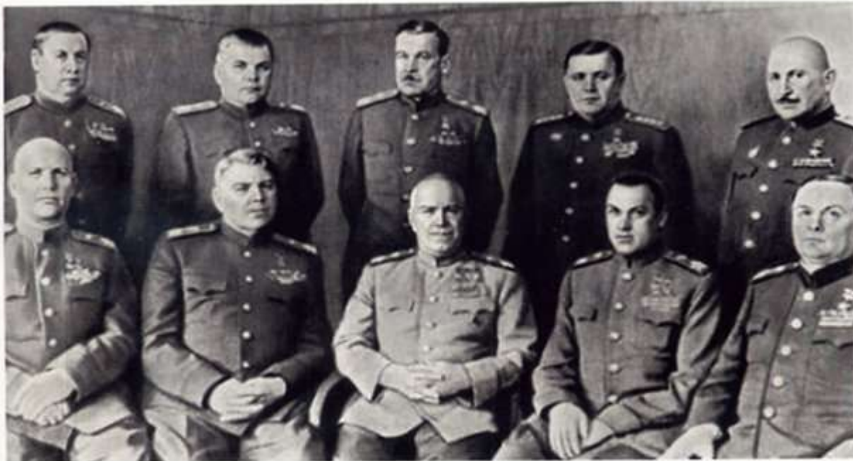
Полководцы Великой Отечественной войны. Командующие фронтами в годы Великой Отечественной войны И. С. Конев, А. М. Василевский, Г. К. Жуков, К. К. Рокоссовский, К. А. Мерецков (сидят, слева направо), Ф. И. Толбухин, Р. Я. Малиновский, Л. А. Говоров, А. И. Еременко, И. Х. Баграмян (стоят, слева направо).