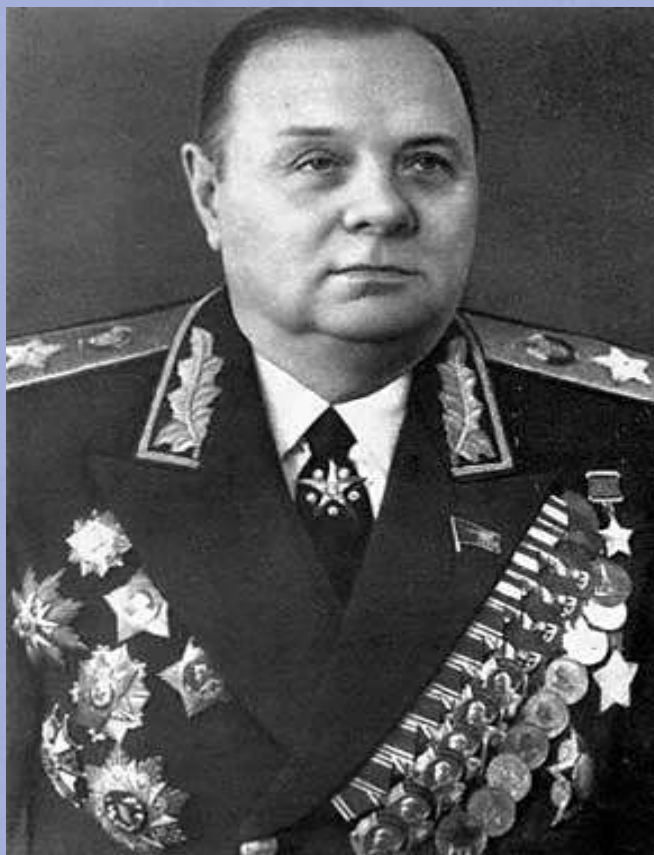
Кирилл Афанасьевич Мерецков