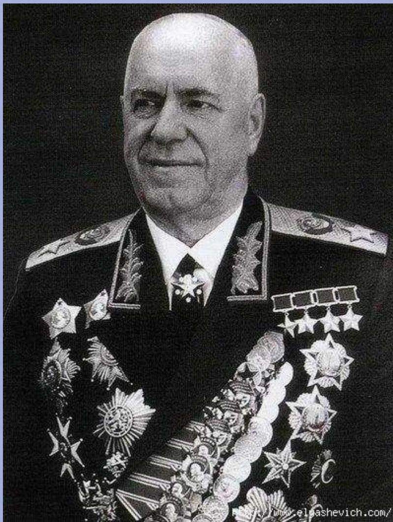
Георгий Константинович Жуков