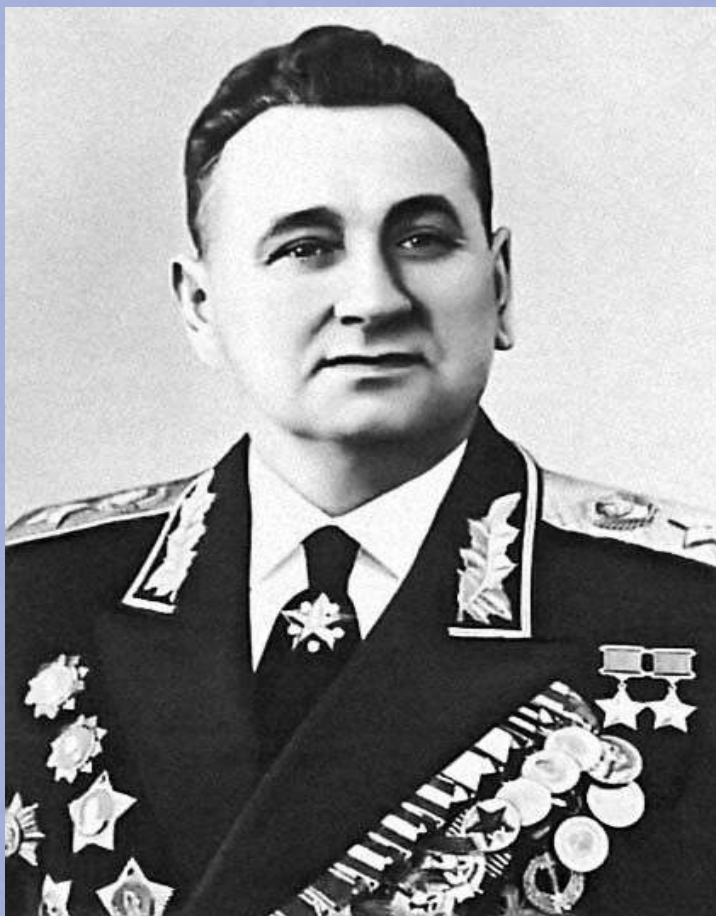
Гречко Андрей Антонович